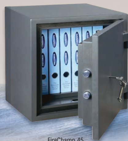
FireChamp 45 Premium DB