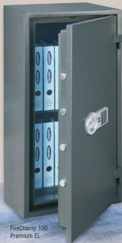
FireChamp 100 Premium EL